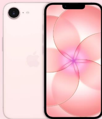
iPhone 17e 256GB