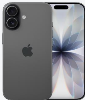
iPhone 17 256GB