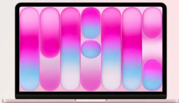
13 吋 MacBook Neo 512GB