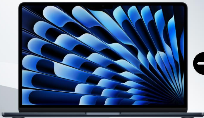
13 吋 MacBook Air (M5) 建議零售價 $8,999