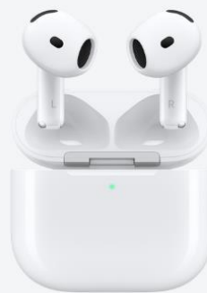
AirPods 4 (主動消噪型號)