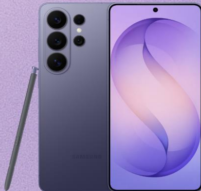
Galaxy S26 Ultra 價值$11,798

50GB + 無限本地數據 + 3GB (其後最高1Mbps) 中國內地及澳門漫遊數據 Δ